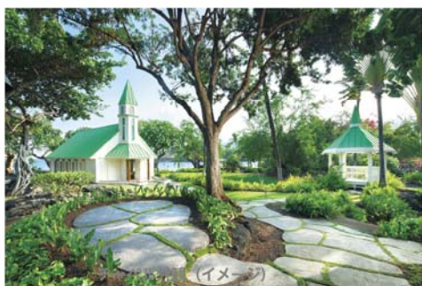
チャペル外観 (イメージ)