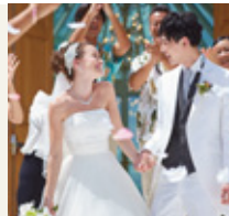
レンタル衣裳 ドレス ¥105,000 タキシード ¥50,000