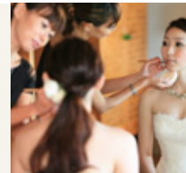
新婦様当日ヘアメイク (90分/日本人確約) ¥43,000