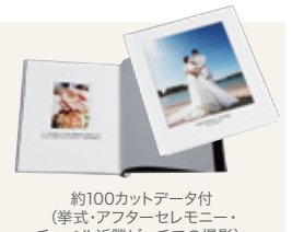
アルバム Liebe (リーベ) 約100カットデータ付 (挙式・アフターセレモニー・チャペル近隣ビーチでの撮影) 12P / 20カット ¥113,000