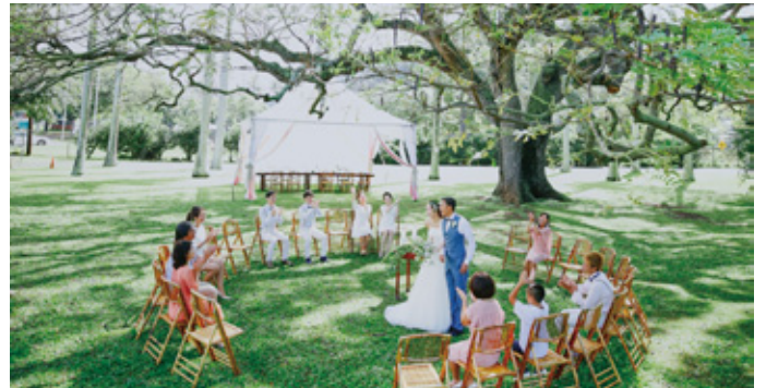
※ガーデン挙式イメージ

※土・日曜日挙式の場合は¥50,000追加料金がかかります ①教会 ②ガーデン 2つのウェディングスタイルよりお選びください