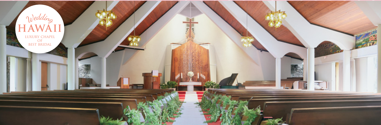
※チャペル挙式イメージ

Wedding HAWAII LUXURY CHAPEL OF BEST BRIDAL